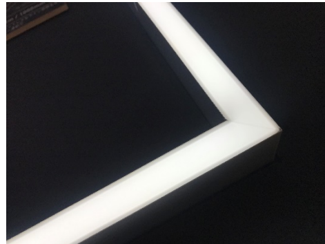
コーナー対応タイプ PFSH